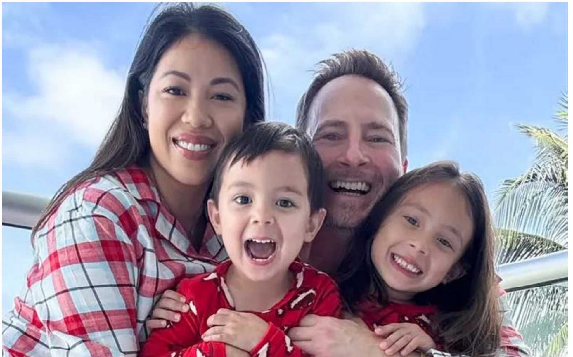
Familia de cuatro encontrada muerta en su casa de Houston.