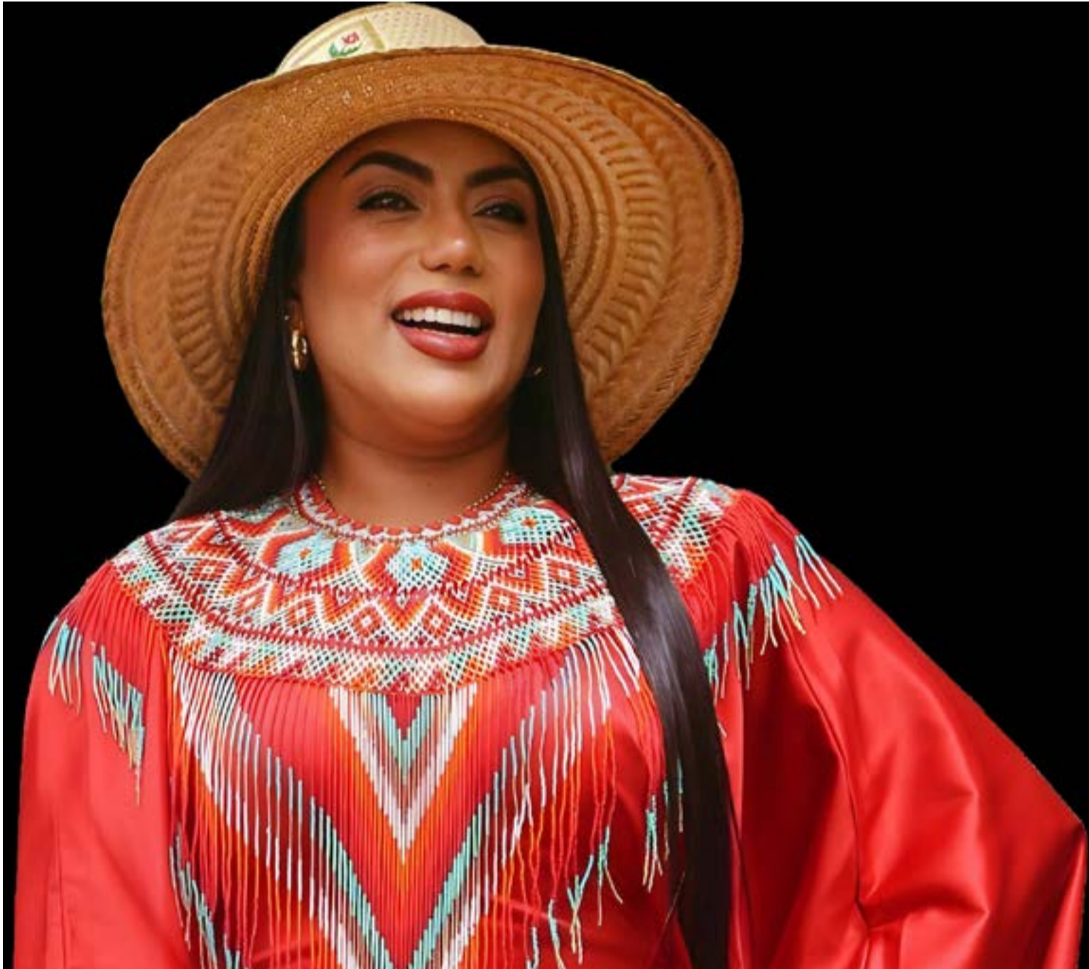
Martha Peralta. senadora de la República