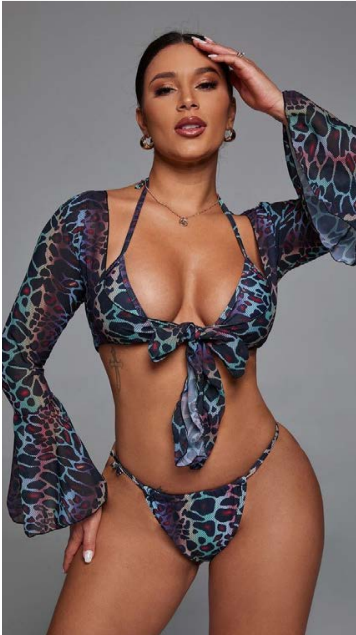
Moda playa con un toque salvaje

Hito histórico: Se lanzó la frecuencia Caracol América 106.3 FM en el sur de la Florida, conectando la información colombiana con la audien-