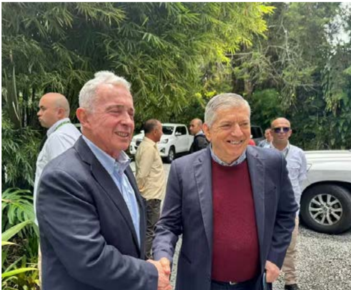
En cumplimiento del denominado «Pacto del Ubérrimo» el Jefe Liberal César Gaviria se comprometió con Álvaro Uribe, apoyar la candidatura de Paloma Valencia.