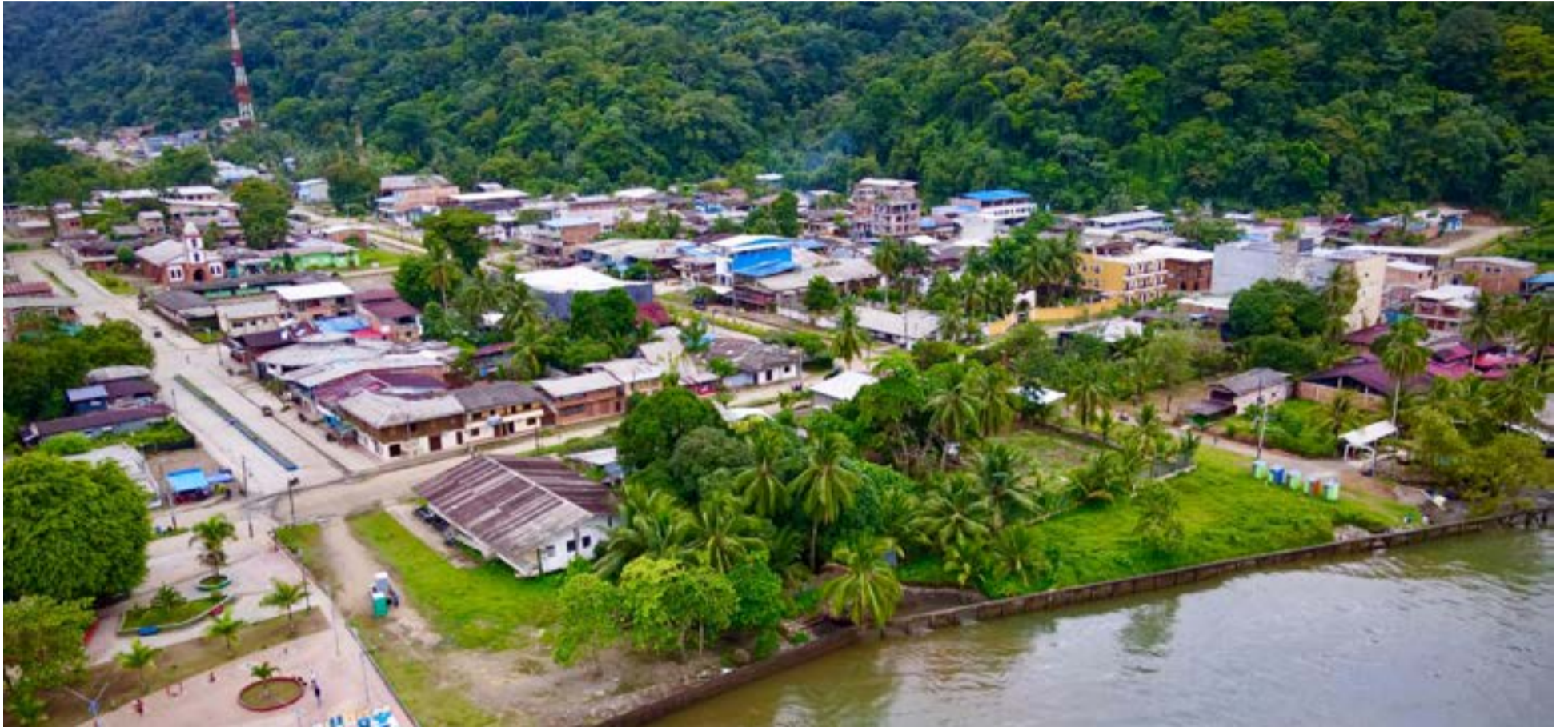
Bahía Solano es un pintoresco pueblo costero ubicado en la región del Pacífico colombiano, conocido por sus playas vírgenes y su exuberante selva tropical. Es un destino privilegiado para el ecoturismo y el avistamiento de ballenas jorobadas.