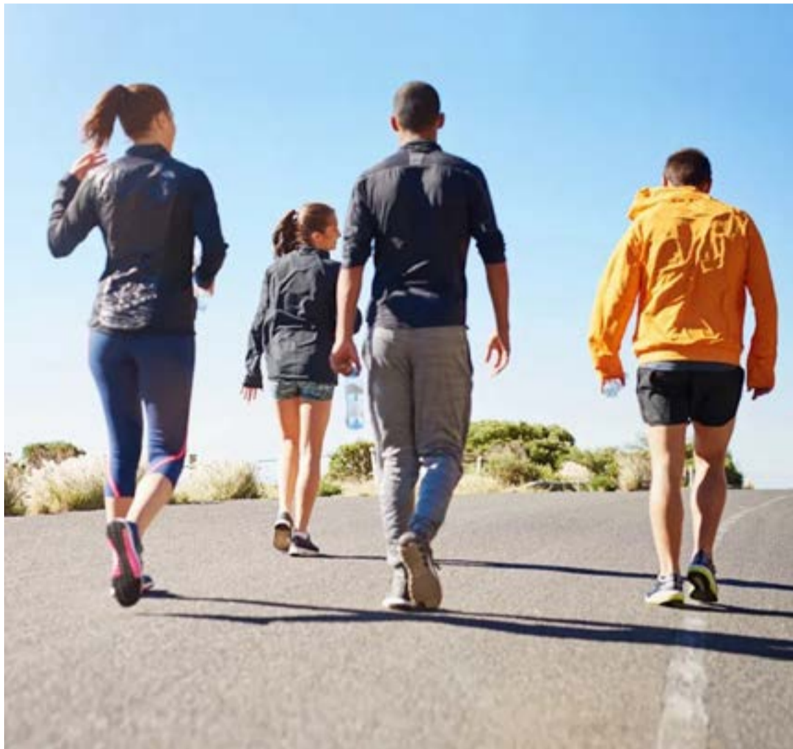
Caminar 30 minutos al día mejora la calidad de vida